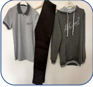
Model - 1