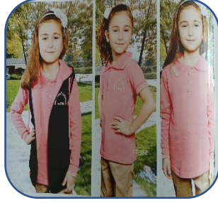
Model - 2