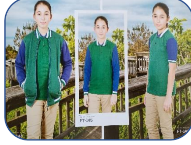
Model - 3

Mevcut kıyafetin kullanımına devam edilmesini istiyorum.